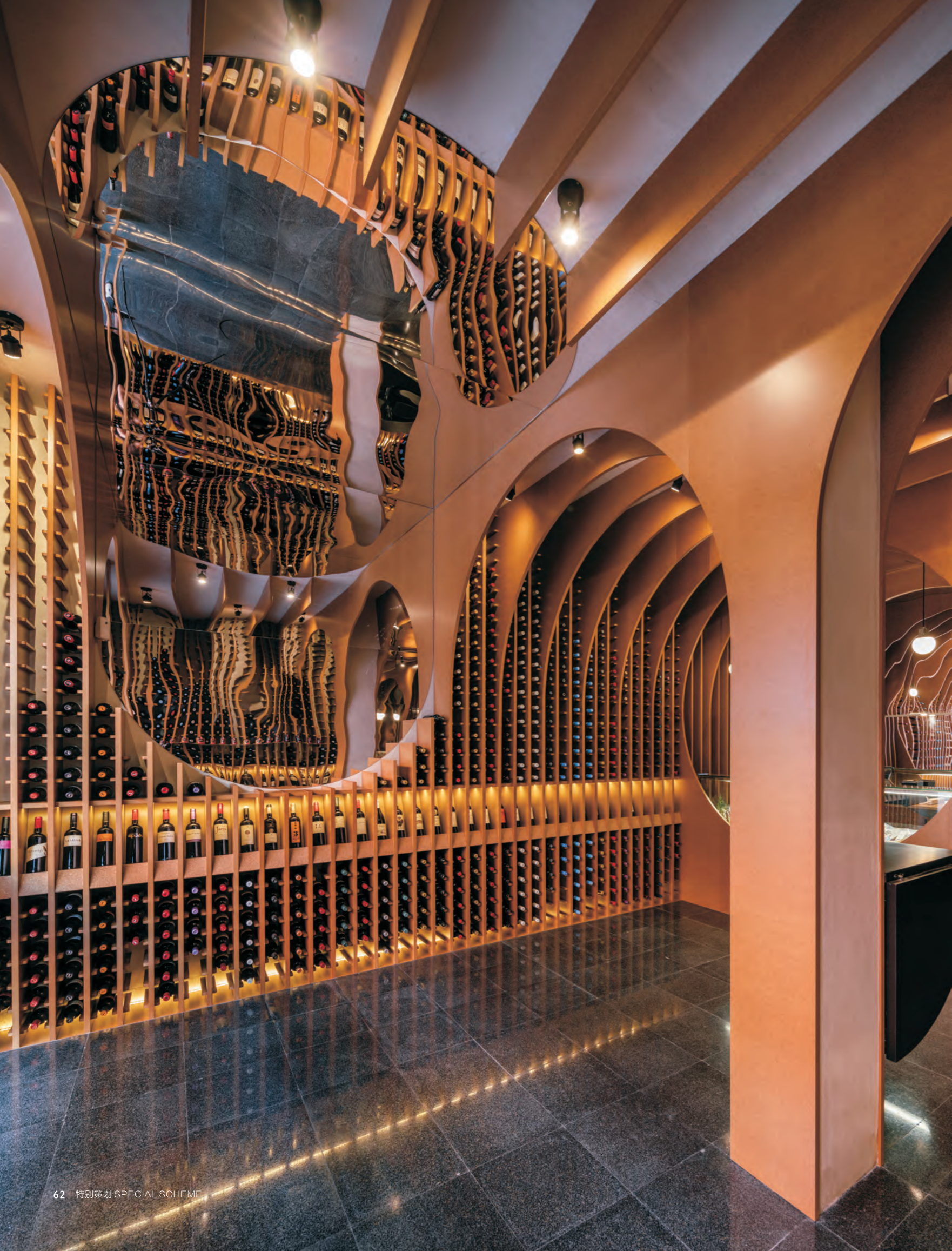
左图 镜面材料让空间充满了流动感 右上图 拱券造型与古老的地下酒窖隔空呼应 右下图 拱券细节