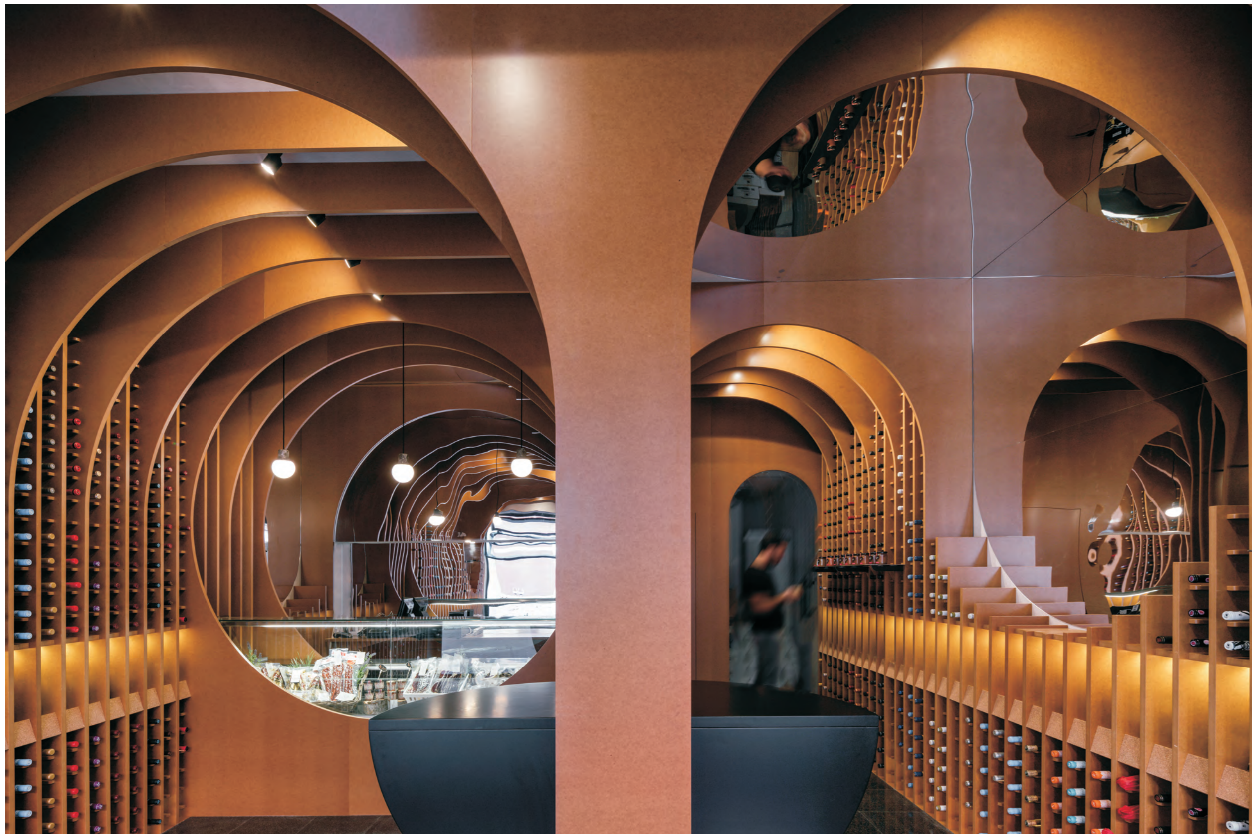
图 设计师将商店呈纵向分割，创造出左右各15cm的垂直空间，用以红酒的展示

商店的设计理念源于对红酒及红酒销售空间的“探索”。关于“探索”的象征符号有很多，设计师最终选择了用圆周图形来描绘“探索”的场景。