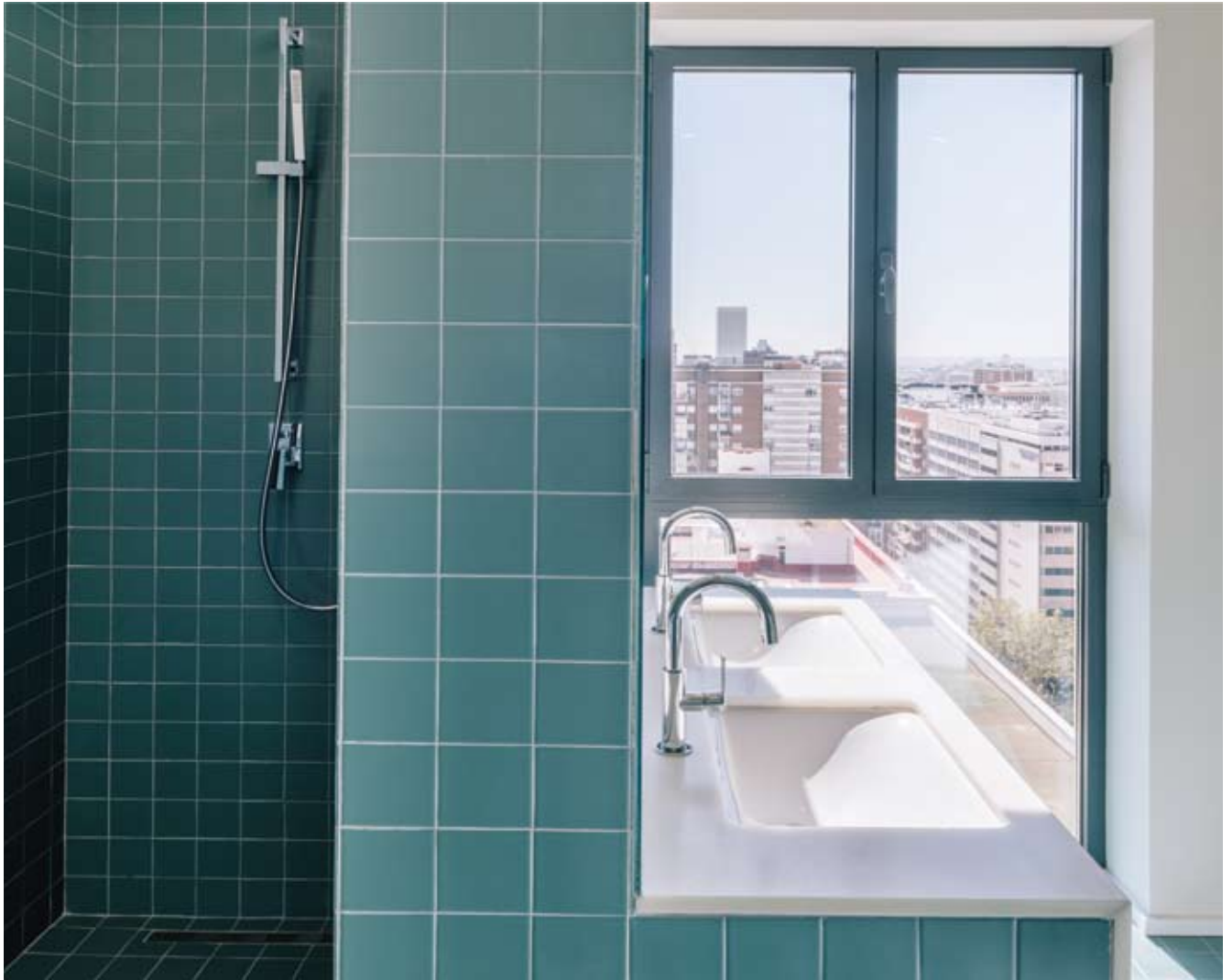
Textos: Ada Marqués .

C 181 es el nombre del nuevo proyecto de vivienda situada en el madrileño Paseo de la Castellana creado por Zooco Estudio. Se trata de la reforma integral de 230 metros cuadrados, en la que el cambio es total y donde el cliente ha expresado la importancia que tiene para él la cocina. Por ello se plantea el espacio de cocina como “corazón” y centro de la casa, generando la circulación y todos los espacios a su alrededor.