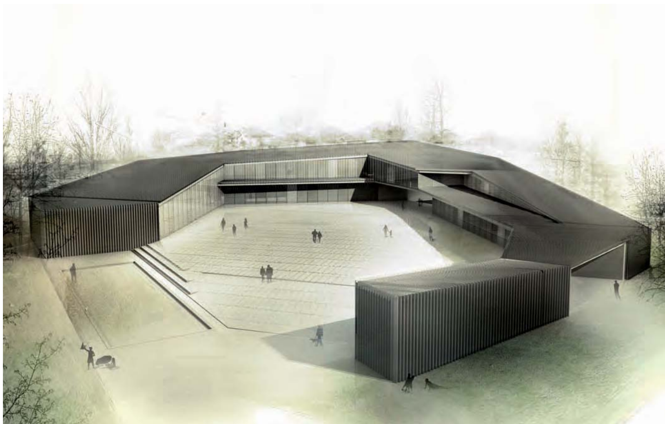
Centro cívico-cultural Soto de la Marina. Zooco Estudio