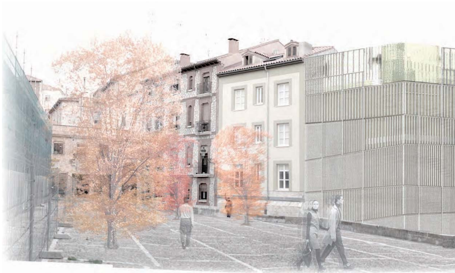
Concurso "Consulado Joven" Burgos. Zooco Estudio

ba al hombre a identificarse con ese "espíritu del lugar" y les proporciona un sensación de pertenencia y seguridad.